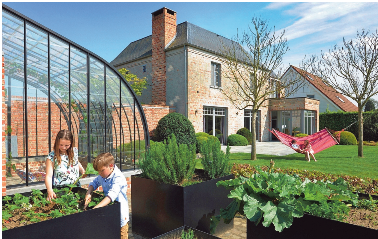
De moestuin bestaat uit een aantal stalen bakken op hoogte waarin groenten, kruiden en fruit worden gekweekt.